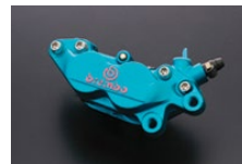
ブルー （ロゴ：レッド）