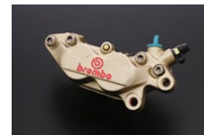
シャンパンゴールド （ロゴ：レッド）